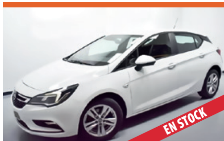
OPEL ASTRA POCOS KM