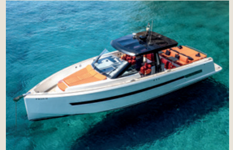
FJORD 48 - Slice