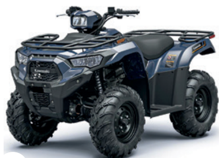
P. 22 KAWASAKI. NUEVO BRUTE FORCE 450

Nº 254 | OCTUBRE 2024 | GRATIS IBIZA Y FORMENTERA | www.top-crono.com