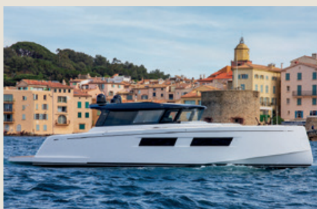
PARDO GT 52 - Entrega inmediata