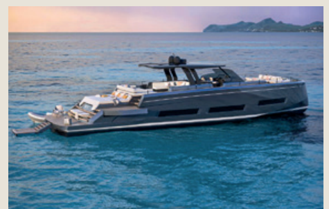
PARDO 75 - Entrega 2025