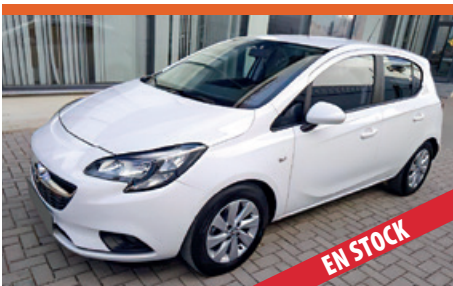
OPEL CORSA POCOS KM