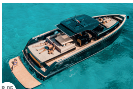
P. 05 GLOBAL YACHTING IBIZA. PARDO 50

SECCION Pitius TOP tu guía de ocio en Ibiza