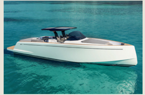
PARDO 50 - Mimi