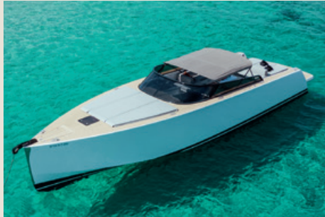
VAN DUTCH 55 - P.ápera