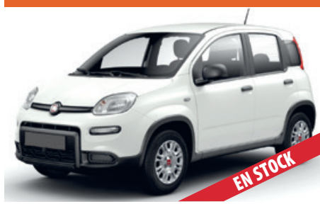
FIAT PANDA POCOS KM