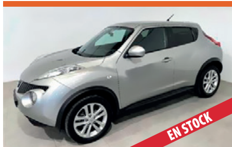
NISSAN JUKE MUY POCOS KM