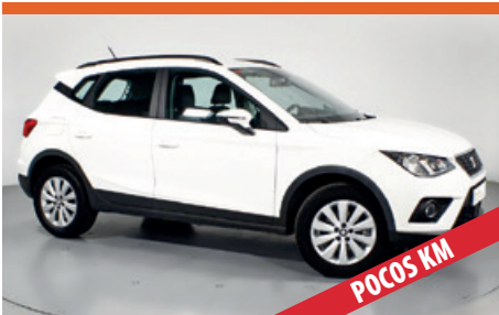
SEAT ARONA EN STOCK