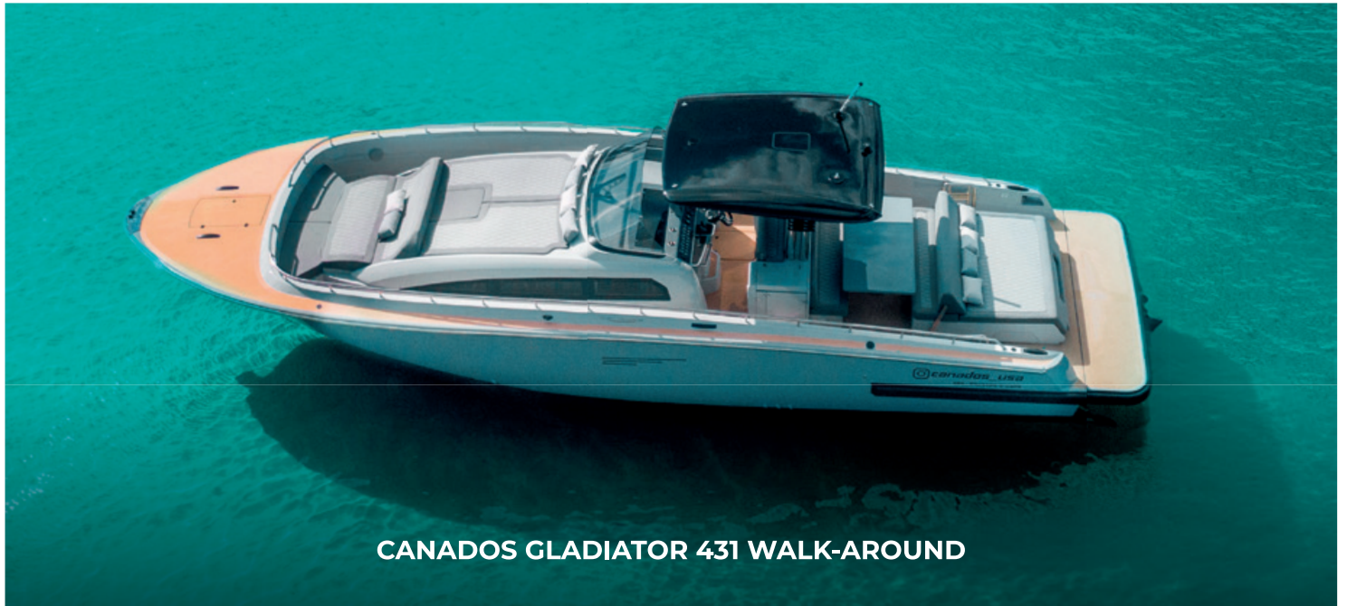
CANADOS GLADIATOR 431 WALK-AROUND