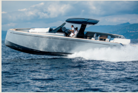
PARDO 43 - 2 of a kind