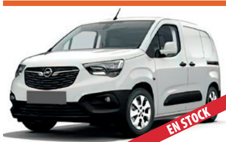
OPEL COMBO MUY POCOS KM