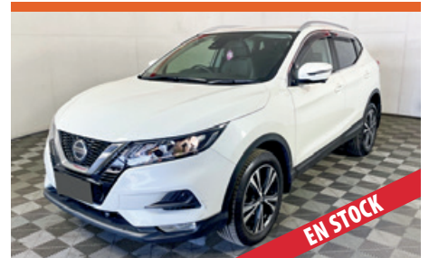
NISSAN QASHQAI SEMINUEVO