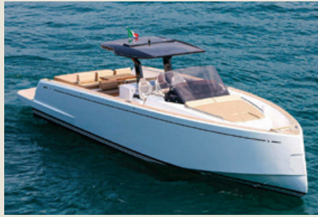
PARDO 43 - Yaaas