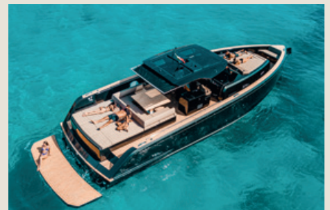
PARDO 50 - Entrega inmediata