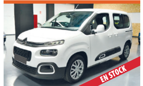
CITROEN BERLINGO COMBI SEMINUEVO

Compra. Venta. Todo tipo de vehículos usados. Seminuevos. Km0. Totalmente revisados y garantizados. Valoramos su vehículo sin compromiso. Amplio stock de vehículos. Si está pensando en vender o cambiar de vehículo ¡Venga a vernos!