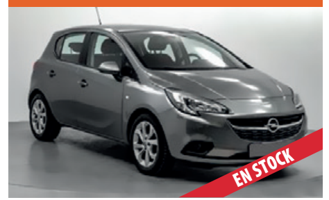
OPEL CORSA POCOS KM