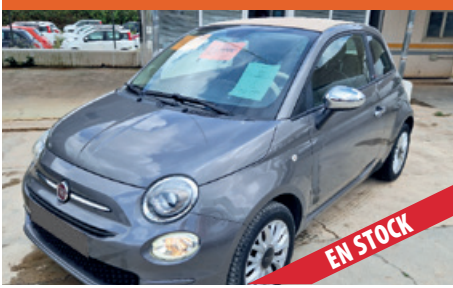
FIAT 500 DESCAPOTABLE POCOS KM

> SEMINUEVOS > POCOS KM. > ENTRADA DESDE 0 € > DESDE 145 € AL MES