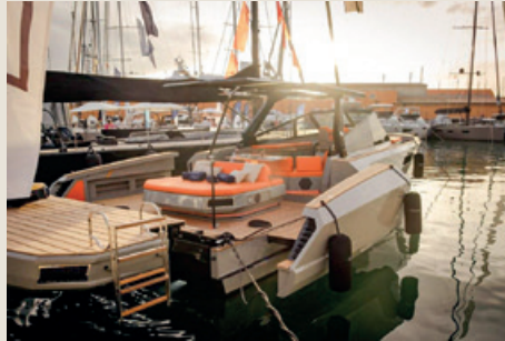
EVO R4 XT WA - Mistral