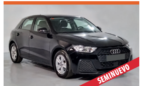
AUDI A1 SPORTBACK POCOS KM