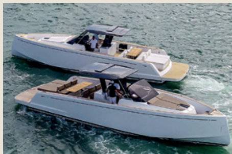
PARDO 43 - Entrega inmediata