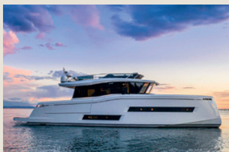
PARDO E60 - Entrega inmediata