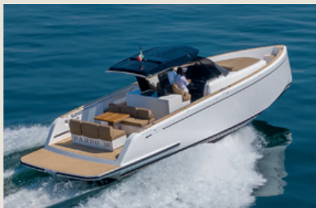
PARDO 38 - Entrega inmediata