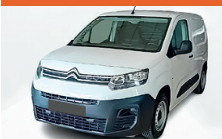
CITROEN BERLINGO SEMINUEVO