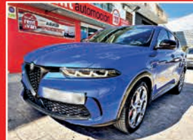
ALFA ROMEO TONALE SPECIALE HEV 135CV AÑO 2022. 20.600 KM. AUT/SEC. NAVI. CLIMA.