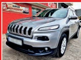
JEEP CHEROKEE LONGITUDE 2.0 D 140CV AÑO 2017. 33.900 KM. PANTALLA, CUERO.