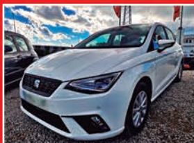
SEAT IBIZA STYLE PLUS 1.0 TSI 110CV AÑO 2022. 34.800 KM. NAVEGADOR, BLUETOOTH.