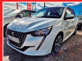
PEUGEOT 208 ACTIVE 75CV AÑO 2020. 38.300 KM. PANTALLA, BLUETOOTH.