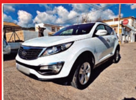
KIA SPORTAGE CONCEPT 1.6 GDI 136CV AÑO 2013. 83.700 KM. CLIMAT, LLANTAS.