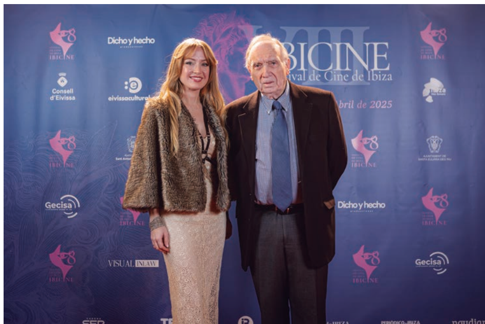
La directora del Festival de Cine de Ibiza, Ibicine y el director de la Academia de Cine, Fernando Méndez-Leite

La VIII Edición de Ibicine, que se celebrará en Ibiza del 6 al 13 de abril, rendirá homenaje a la película Gladiator , en su 25º aniversario, con una temática inspirada en la Antigua Roma