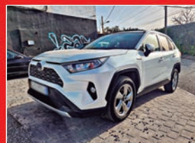
TOYOTA RAV 4 BUSINESS HEV 218CV AÑO 2019. 62.000 KM. TECHO, NAV, CÁMARA.