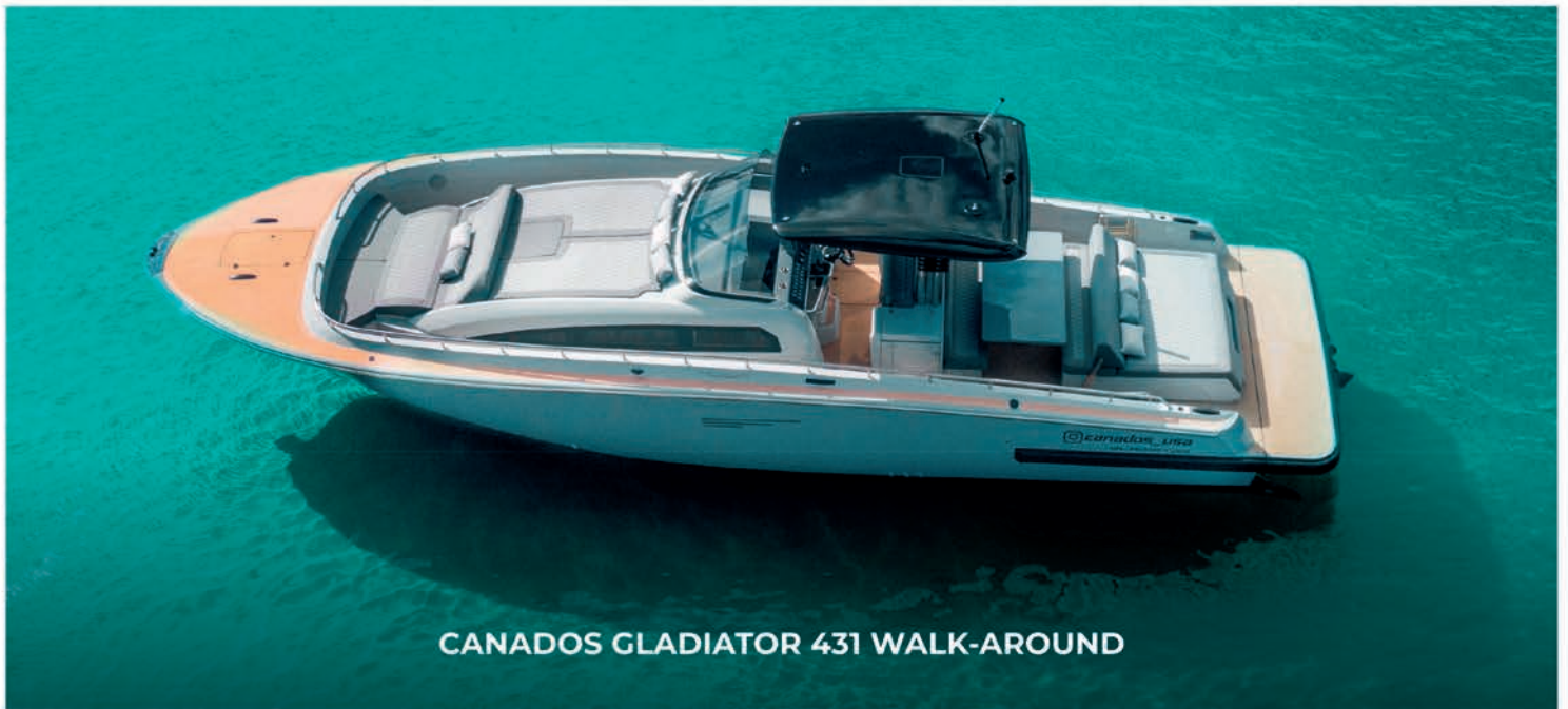
CANADOS GLADIATOR 431 WALK-AROUND