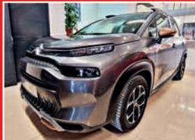
CITROEN C3 AIRCROSS "C" SERIES BLUEHDI 110CV AÑO 2022. 21.700 KM. CAMARA. PANTALLA.