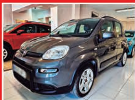
FIAT PANDA CITY LIFE 1.0 HIBRID AÑO 2023. 24.900 KM. LLANTAS, BLUETOOTH.