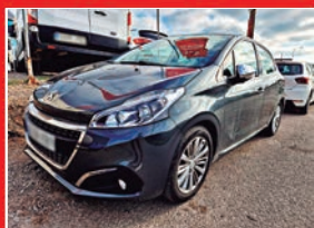
PEUGEOT 208 ALLURE 82CV AÑO 2017. 36.800 KM. NAV, PANTALLA, CÁMARA.