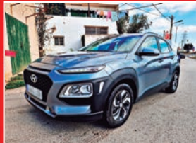
HYUNDAI KONA KLASS DCT 1.6 HEV 141CV AÑO 2019. 56.200 KM. AUT/SEC, CARPLAY, CÁMARA.