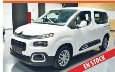
CITROEN BERLINGO COMBI