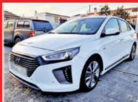
HIUNDAI IONIQ STYLE DCT HIBRID 141CV AÑO 2016. 65.650 KM. CUERO, TECHO, NAVEGADOR.