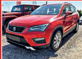
SEAT ATECA STYLE 1.0 TSI 115CV AÑO 2017. 84.767 KM. ASISTENTE DE CARRETERA.