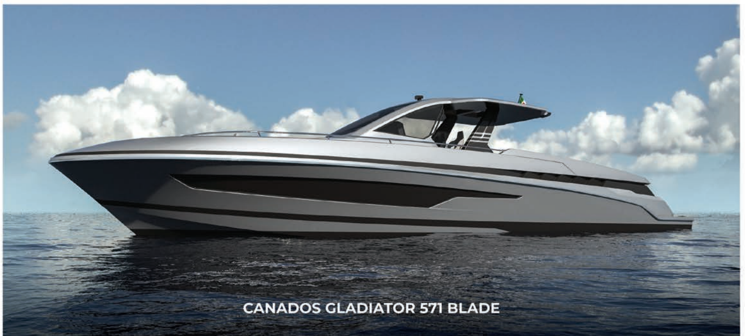
CANADOS GLADIATOR 571 BLADE