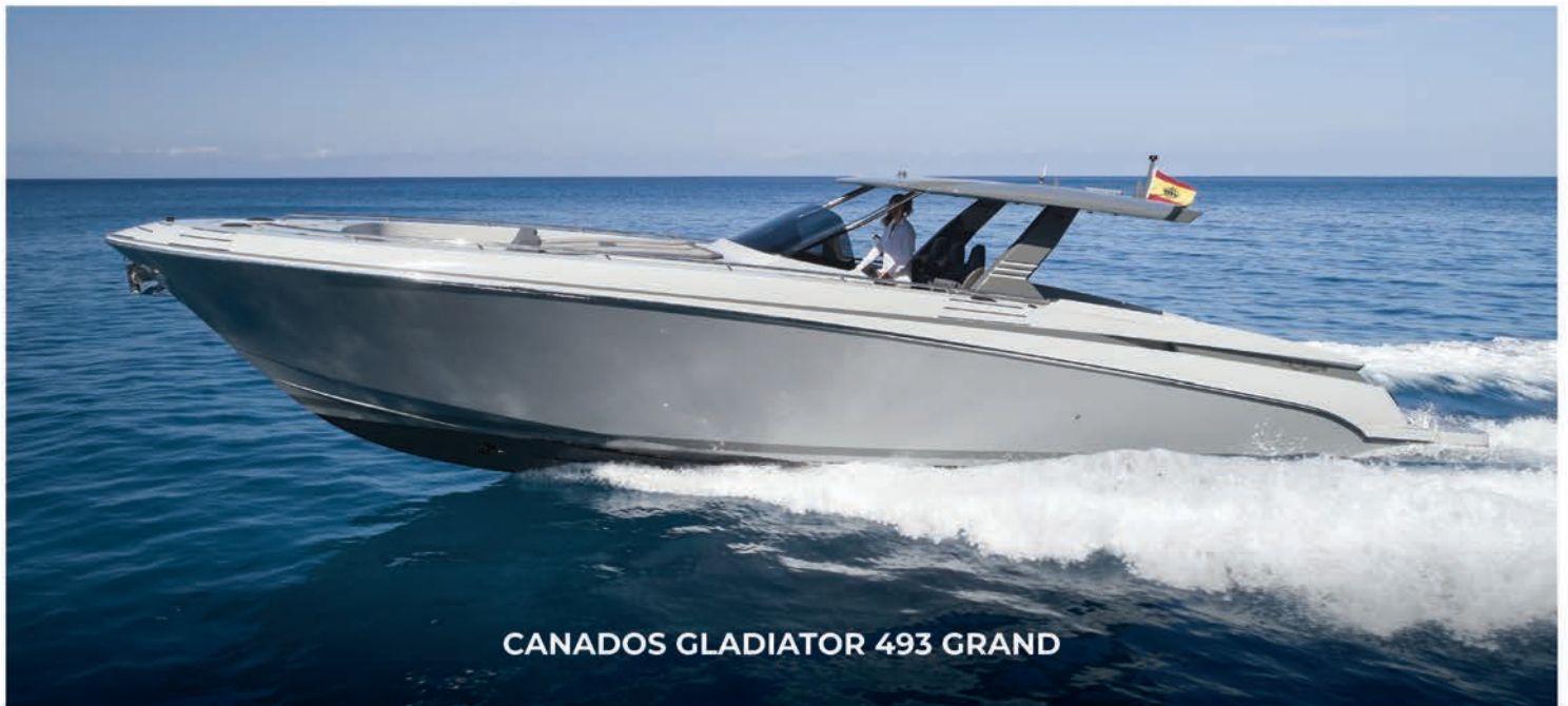
CANADOS GLADIATOR 493 GRAND