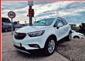
OPEK MOKKA X INNOVATION 1.6 DCTI 136CV AÑO 2019. 95.500 KM. CAMARA, PANTALLA.