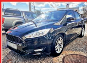
FORD FOCUS TREND 1.0 ECOBOOST 125CV AÑO 2016. 71.000 KM. CLIMATIZADOR, BLUETOOTH.